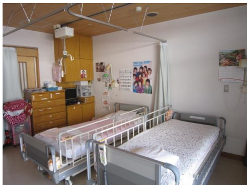
ご利用者居室(2人部屋)

レールシステムとリフト吊り具の多彩な組み合わせにより、天井走行リフトをご利用者の介護度に合わせ多用に活用できる設備を取り入れています。